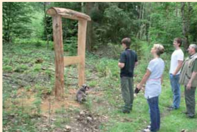
Der Blick ins Detail wird durch natürlich Rahmen geschärft.