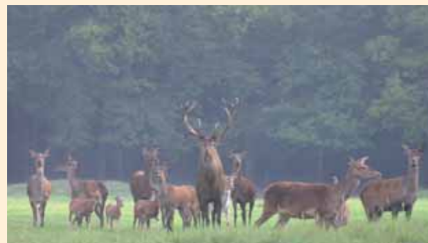
Prominente Bewohner der Göhrde: Rot- und Damwild sowie Mufflons.

Nach dem Besuch des Museums können Sie die Göhrde zu Fuß erkunden und die Natur in all ihren Facetten direkt erfahren. Ein Wanderpfad und ein Erlebnis-Parcours in-